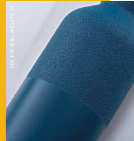
STRUKTUR IM WERKZEUG