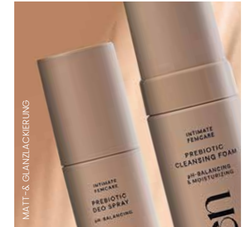
MATT- & GLANZLACKIERUNG