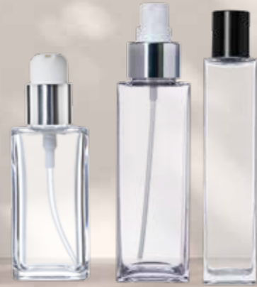
QUATTRO & QUATTRO SLIM GLASS-LIKE