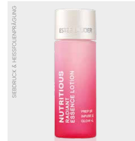
SIEBDRUCK & HEISSFOLIENPRÄGUNG