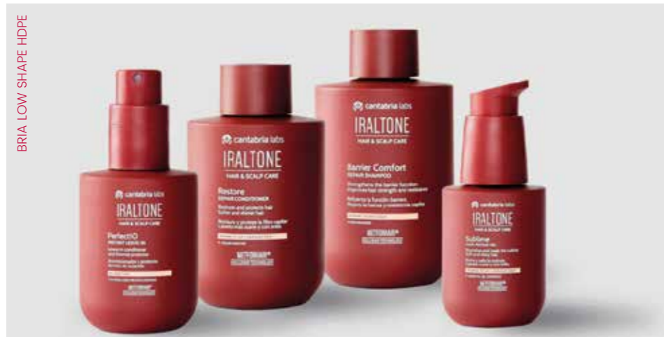
BRIA LOW SHAPE HDPE